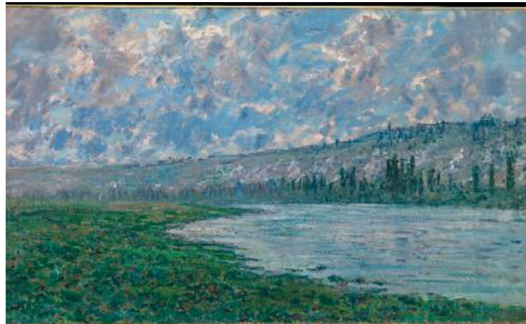
Monet, The Seine at Vétheuil (1880)

( Will Durant , Αμερικανός ιστορικός και φιλόσοφος, 1885-1981)