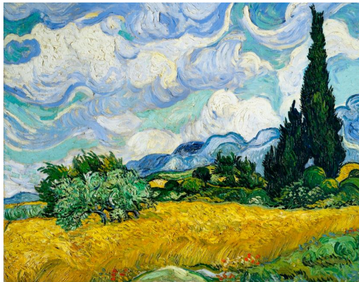
Wheat Field with Cypresses (1889) by Vincent Van Gogh . Original from the MET Museum.

Πηγές εικόνων πενταγράμμου: https://www.vectorstock.com/royalty-free-vector/set-musical-staff-various-musical-notes-on-stave-vector-17879623 , https://gr.pinterest.com/pin/148970700144311172/