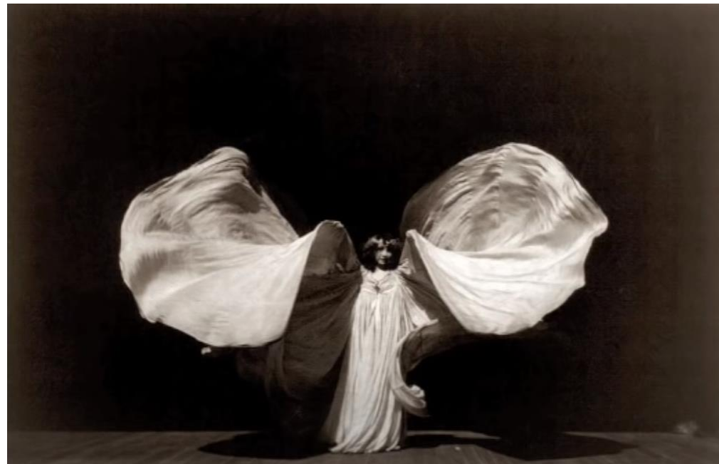
Αμερικανίδα χορεύτρια Loie Fuller (1862-1928), πιθανή έμπνευση του 'Voiles'

https://www.youtube.com/watch?v=VrVyQhUM5C4&ab_channel=caprottimusic