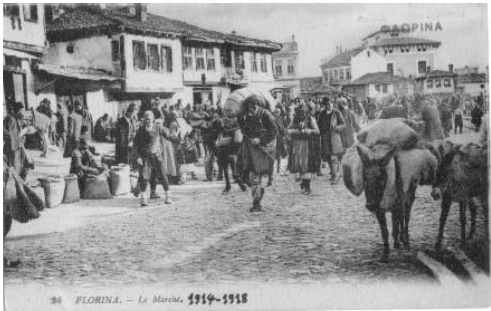
34 FLORINA. — Le Marché. 1914-1918