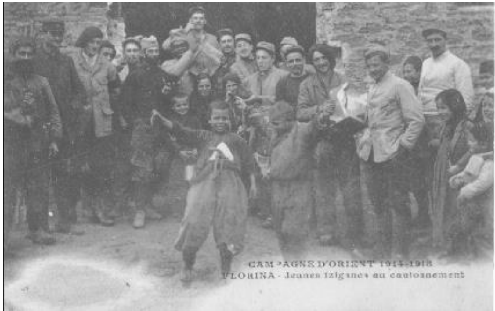
CAMPAIGNS D'ORIENT 1914-1918 FLORINA - Jeunes tziganes au cantonnement