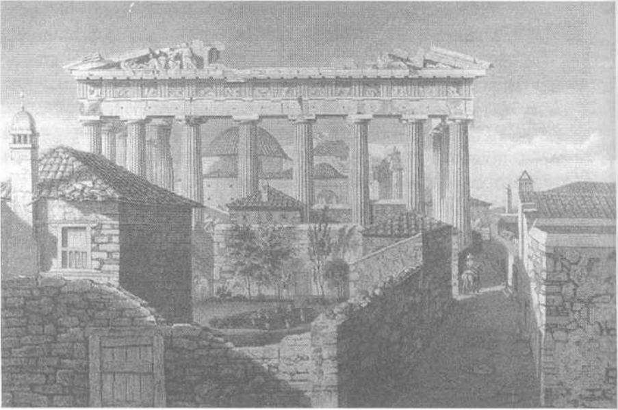
Εικ. 3.1 Ο Παρθενώνας και τα γύρω από την Ακρόπολη κτίσματα, όπως απεικονίζονται σε εικαστικό έργο του 18ου αιώνα· διακρίνεται καθαρά το μουσουλμανικό τέμενος μέσα στον σιρκό του ναού.

Έχει ενδιαφέρον να σημειώσουμε ότι, όταν ο Von Klenze εξήγγειλε στον λόγο του πάνω στην Ακρόπολη ότι «όλα τα λείψανα της βαρβαρότητας θα εξαλειφθούν», δεν συμπεριελάμβανε σε αυτό τον ορισμό κτίσματα όπως ο μεσαιωνικός πύργος των Προφυλαίων (και ο ενετικός προμαχώνας τους). Μάλιστα, ο Von Klenze τάχθηκε υπέρ της διατήρησης ορισμένων μεσαιωνικών οικοδομημάτων λόγω του «γραφικού» χαρακτήρα τους και αναφέρθηκε ειδικά στον μεσαιωνικό πύργο των Προφυλαίων (Παπαγεωργίου-Βενετάς 2001: 164). Η άποψη αυτή καθιερώθηκε με επίσημο διάταγμα που εξέδωσε η Αντιβασιλεία τον Σεπτέμβριο του 1834 (πιθανώς κατόπιν δικής του συστάσεως), το οποίο ενθάρρυνε την προστασία νεότερων κτισμάτων (μεταξύ των οποίων αναφέρονται ρητά οι εκκλησίες και τα τζαμιά), εάν «θεωρούνται άξια διατηρήσεως λόγω ιστορικού ενδιαφέροντος ή γραφικότητας» (Παπαγεωργίου-Βενετάς 2001: 330). Εντούτοις, παρά την αναφορά στα τζαμιά (και την προφανή ευαισθησία για τις εκκλησίες, οι οποίες αποτελούσαν τόπους λα-