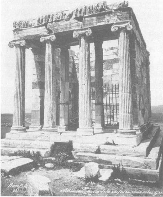
Εικ 3.4 Φωτογραφία του ναού της Αθηνάς Νίκης από τον Bonfils (πρβλ. Hamilakis 2001 β· Szegedy-Maszak 2001).

έθνους, τις στρατηγικές αναδημιουργίας του αρχαίου μεγαλείου και τη μετατροπή των αρχαίων λειψάνων σε οριοθετημένα εθνικά αρχαιολογικά μνημεία, τα οποία στο εξής θα εξετίθεντο προς οπτική κατανάλωση, αποχωρισμένα από τόν ιστό της καθημερινής ζωής (πρβλ. Hamilakis 2001β· Szegedy-Maszak 2001' Lyons κ.ά. 2005). Το φαινόμενο αυτό χρήζει λεπτομερέστερης εξήγησης, καθώς αναφύεται στη διασταύρωση ενός αριθμού παράλληλων διαδικασιών και ιδεών. Οι επαγγελματίες φωτογράφοι του 19ου αιώνα, ανταποκρι- νόμενοι στη ζήτηση για ακραιφνείς, στερεότυπες απεικονίσεις κλασικών αρχαιοτήτων από το δυτικό κοινό, πραγματοποιούσαν τη δική τους οπτική απο- κάθαρση, καδράροντας τα θέματά τους έτσι ώστε αυτά να μην περιλαμβάνουν κανένα ίχνος της συγκαρινής Αθήνας. Με τον τρόπο αυτό δημιουργούσαν ένα μνημειακό τοπίο, στερούμενο οποιοσδήποτε σύγχρονης κοινωνικής αλληλεπίδρασης (Εικ. 3.5 και 3.6) - ένα γνωστό αποικιοκρατικό επινόημα.