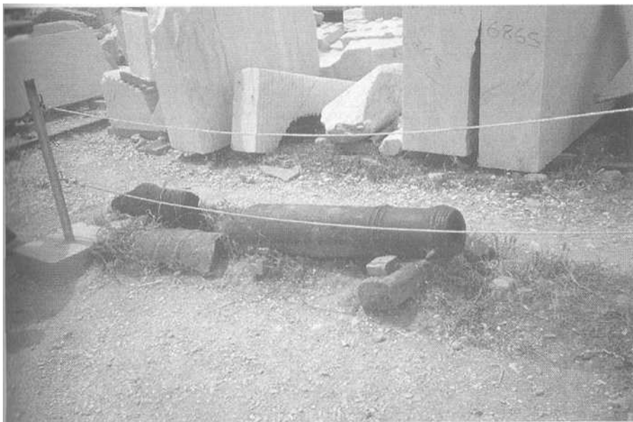
Εικ. 3.8 Φωτογραφία ενός κανονιού στην Ακρόπολη.

ελληνισμός, το ελληνικό εθνικό φαντασιακό, η αρχαιολογία και η φωτογραφία, είχε διαγράψει έναν πλήρη κύκλο.