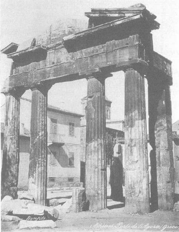
Εικ. 3.5 Φωτογραφία της «Πύλης της Αθηνάς Αρχηγέτιδος» (στη Ρωμαϊκή Αγορά) από τον Bonfils· ο φωτογράφος έχει φροντίσει να κρύψει τεχνηέντως τον χριστιανικό ναό πίσω από έναν κίονα (πρβλ. Hamilakis 2001β· Szegedy-Maszk 2001).

Συγχρόνως, μπορούμε να δούμε σε αυτές τις φωτογραφίες τα σημάδια (π.χ. περιφράξεις) που οριοθετούσαν τα αρχαία κτίσματα στην αναστηλωμένη μορφή τους ως μνημείων (π.χ. Εικ. 3.7). Από τα μέσα του 19ου αιώνα και μετά, παρατηρούμε στην Ελλάδα τη συνδυασμένη δράση δύο καιρίων ανα- παραστατικών μηχανισμών της νεωτερικότητας, του αρχαιολογικού και του φωτογραφικού. Τουτέστιν: η διαδικασία παραγωγής της υλικότητας της κλασικής αρχαιότητας, η οποία, όπως είδαμε, ξεκίνησε από τα πρώτα χρόνια του ελληνικού εθνικού κράτους και η οποία αρχικά αποτέλεσε πρωτοβουλία αρχιτεκτόνων και αρχαιολόγων του βαυαρικού περιβάλλοντος του Όθωνα (αλλά σύντομα υιοθετήθηκε με ενθουσιασμό από τους Έλληνες αρχαιολόγους), εμπεριείχε την αποκάθαρση, την αναδημιουργία, την οριοθέτηση και την έκθεση. Ο εθνικισμός, ως δεσπόζουσα ιδεολογία της νεωτερικότητας που εισήχθη