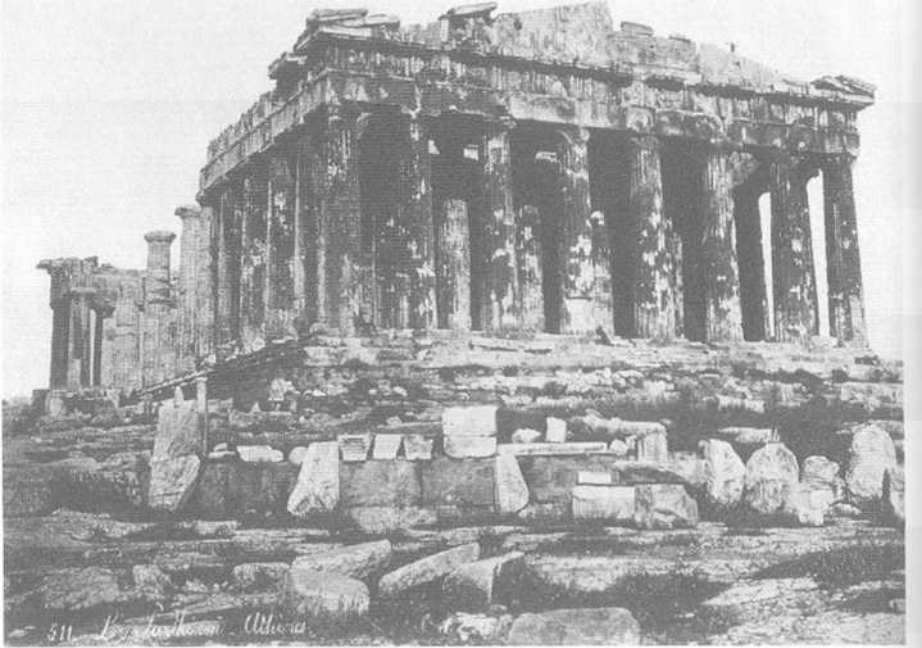
Εικ. 3.3 Φωτογραφία του Παρθενώνα από τον Bonfils (πρβλ. Hamilakis 2001β· Szegedy-Maszak 2001).

ανατολών και εκ δυσμών εισβολείς, τους οποίους ταύτισαν με τη βαρβαρότητα. Η χρονική στιγμή κατά την οποία εκδηλώθηκε αυτή η αλλαγή είναι σημαντική' βρισκόμαστε στην περίοδο κατά την οποία ο ανατολικός Μεσαίωνας, δηλαδή το Βυζάντιο, αποκαθίσταται και ενσωματώνεται στην εθνική αφήγηση. Για τον λόγο αυτό, η μονοσήμαντη δυαδική αντίθεση Ανατολή/Δύση έγινε τώρα πιο πολύπλοκη.