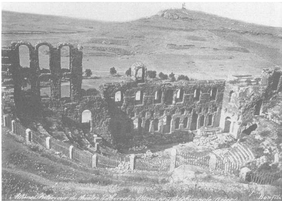
Εικ. 3.7 Φωτογραφία του Ωδείου Ηρώδου του Αττικού από τον Bonfils' διακρίνεται η περίφραξη που διαχωρίζει το μνημείο από τον περιβάλλοντα χώρο (πρβλ. Hamilakis 2001β· Szegedy-Maszak 2001).

θέματα, ενώ οι φωτογράφοι φρόντιζαν για την οπτική αναπαραγωγή τους και την ευρεία κυκλοφορία τους. Κατά συνέπεια, οι δύο μηχανισμοί, ο φωτογραφικός και ο αρχαιολογικός, αποτελούσαν μέρος της ίδιας διαδικασίας και λειτουργούσαν μέσα στο ίδιο πλαίσιο. Η εξιδανικευμένη δυτική αντίληψη περί κλασικής αρχαιότητας κατασκεύασε μια μνημειοποιημένη εικόνα της νεοελληνικής κοινωνίας. Αυτή η εικόνα υιοθετήθηκε από το νέο κράτος ως οδός που θα το οδηγούσε στη νεωτερικότητα. Αυτή η μνημειοποίηση εμπεριείχε, μεταξύ άλλων, την κατασκευή της υλικής πραγματικότητας των κλασικών μνημείων σύμφωνα με την εξιδανικευμένη και αποστειρωμένη αντίληψη της ιστορίας και της αρχαιότητας. Τα μνημεία αυτά έγιναν ακολούθως τα ιδεώδη θέματα για τις στερεότυπες οπτικές παραστάσεις τις οποίες το δυτικό κοινό (συμπεριλαμβανομένων των περιηγητών και, αργότερα, των τουριστών) ονειρευόταν και ζητούσε. Η όλη διαδικασία, στην οποία εμπλέκονταν ο δυτικός