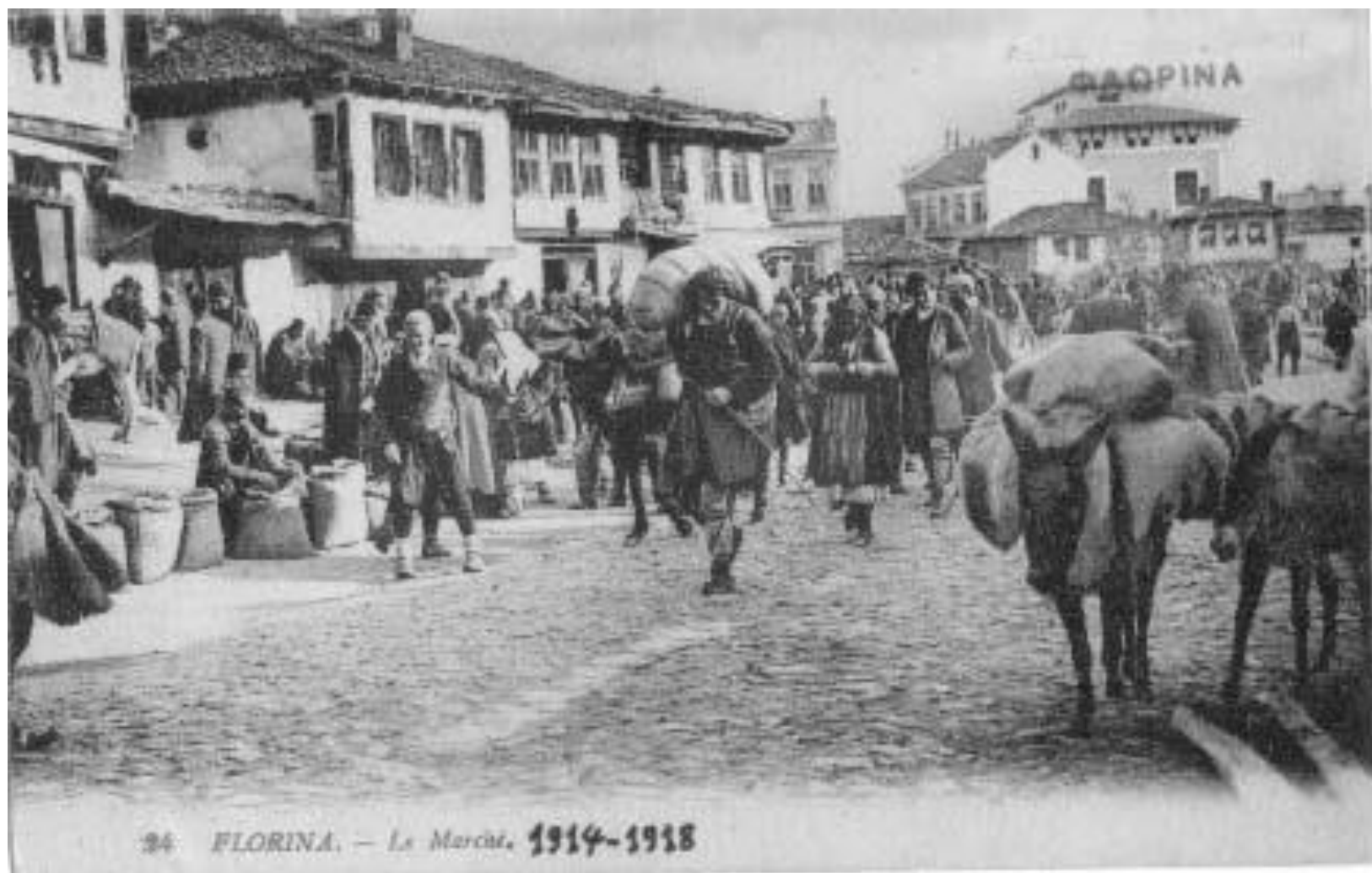
34 FLORINA. — Le Marché. 1914-1918