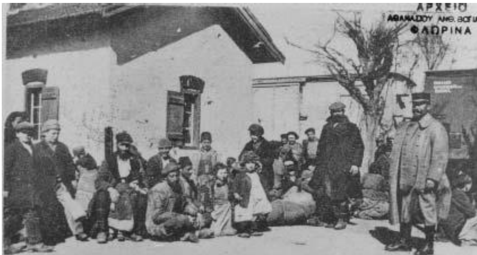
9. Macedoine - FLORINA-STATION - Réfugiés de Monastir attendant leur évacuation sur Salonique Refugees from Monastir awaiting their evacuation to Salonica - 1917 -