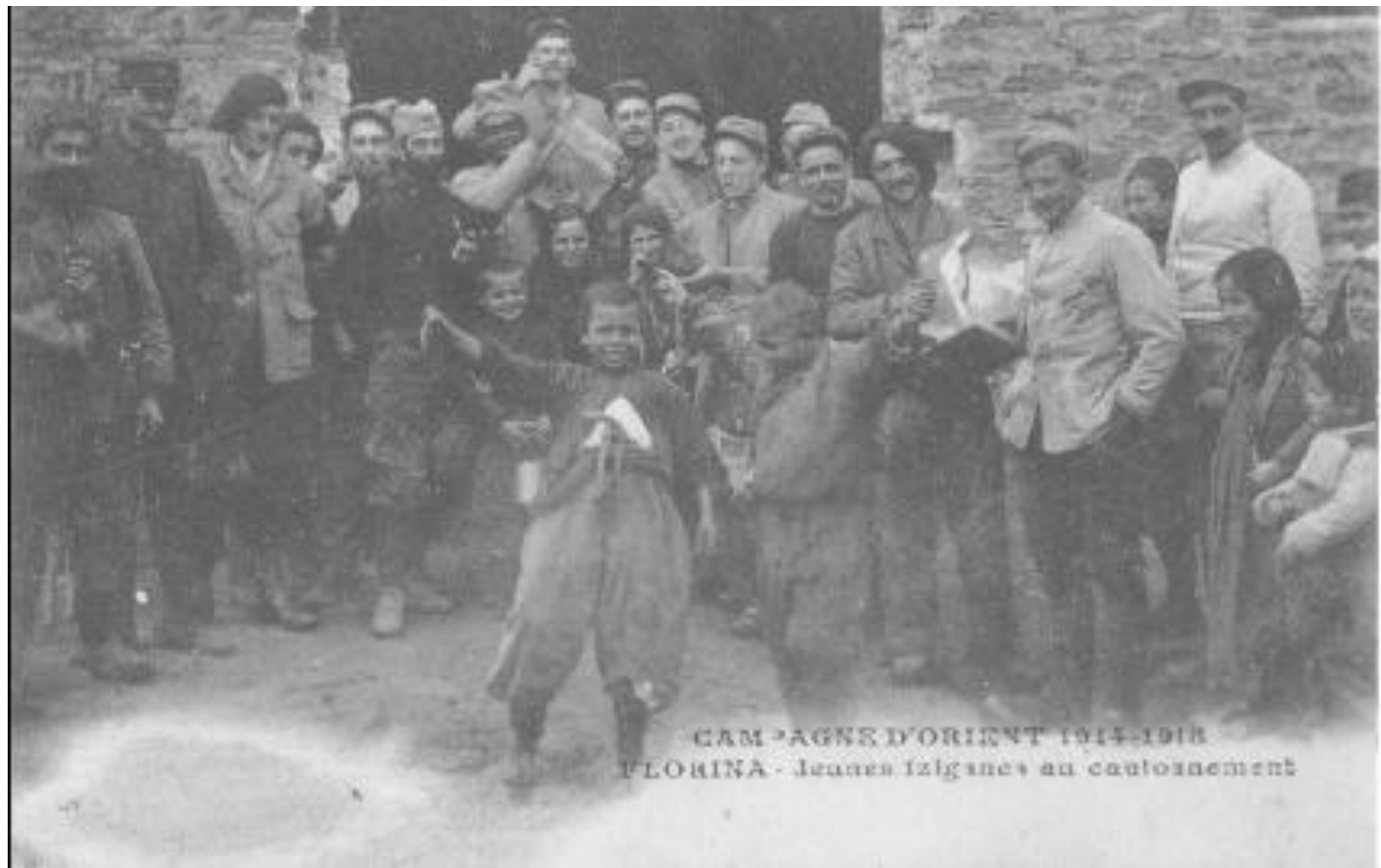
CAMPAGNE D'ORIENT 1914-1918 FLORINA - Jeunes tziganes au cantonnement