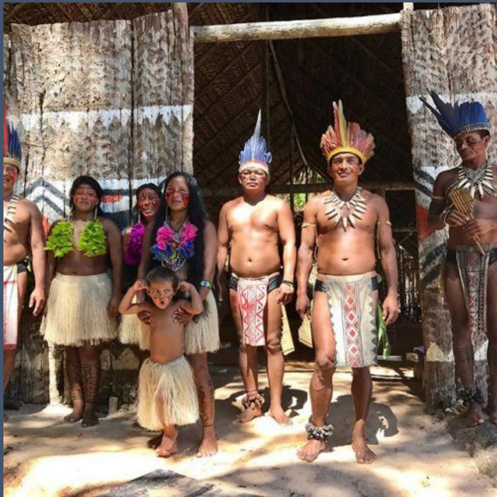
Τυκανο, Αμαζόνιος (Κυρίως Κολομβία, ορισμένοι και στη Βραζιλία)