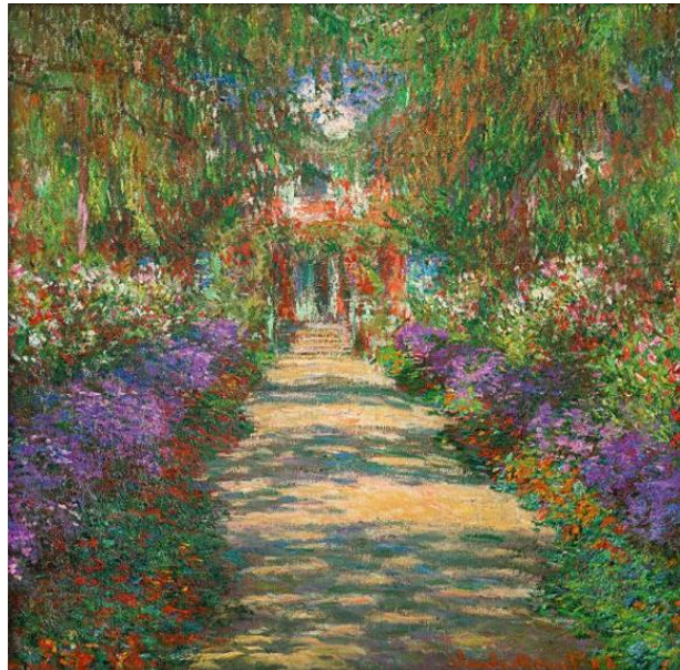
Une Allée du jardin de Monet, Giverny (1902) by Claude Monet .

Είμαστε εις το «εμείς» κι όχι εις το «εγώ». ( Μακρυγιάννης )