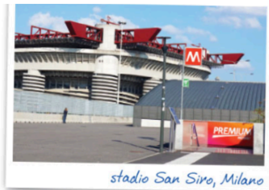
stadio San Siro, Milano