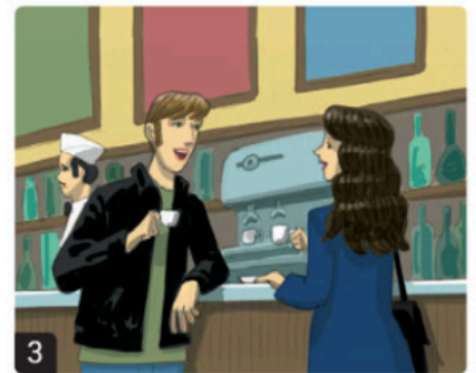
3 andare / bar