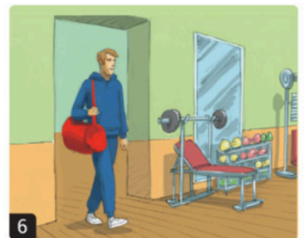
6 andare / palestra