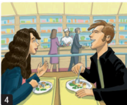
4 mangiare / mensa