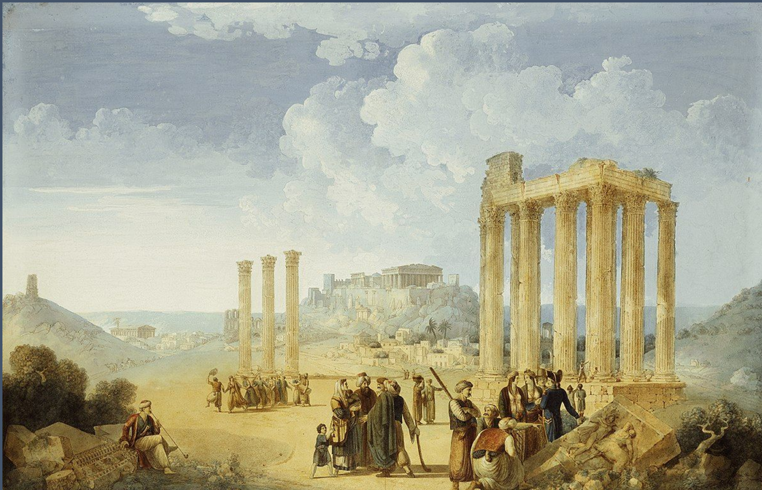
Louis-François Cassas, Ο Ναός του Ολυμπίου Διός, 1787